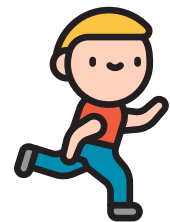
بالارفتن، تعادل داشتن، دویدن و پریدن