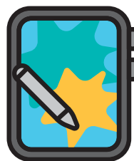
استفاده از فناوری‌های دیجیتال