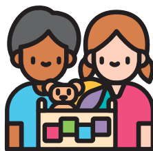
فرصت‌هایی برای به اشتراک گذاشتن با کودکان دیگر و مستقل شدن