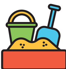
بازی با خاک رس، خمیر بازی، ماسه و آب