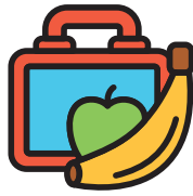
یک ظرف ناهار با ناهار و مقداری میان وعده