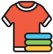
بدیلی کی کپڑے بشمول موزے اور زیر جامہ