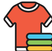
一些换洗衣服 包括袜子和内衣裤