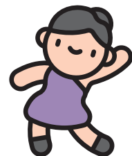
การเต้นรำ และละคร