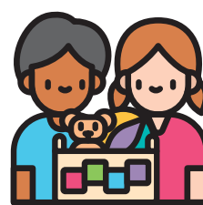
Cơ hội chia sẻ với những trẻ khác và phát triển tính tự lập