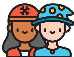
Mặc quần áo và chơi theo trí tưởng tượng