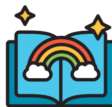
Khám phá sách, nghe truyện và kể chuyện