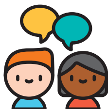
Nói và nghe