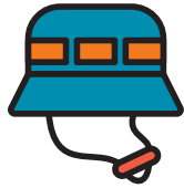
Một chiếc mũ/ nón