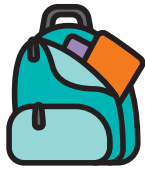
Một chiếc túi