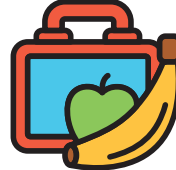
Một hộp đồ ăn chứa đồ ăn trưa và ăn vặt