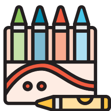
Tô màu, vẽ, cắt và dán

Con quý vị sẽ được trải nghiệm nhiều hoạt động học tập khác nhau.