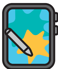
Sử dụng công nghệ kỹ thuật số