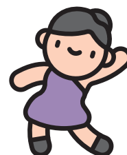
Nhảy múa và kịch