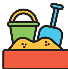
Chơi với đất sét, chơi bột, cát và nước