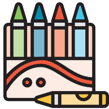
പെയിന്റിംഗ്, ചിത്രവരയ്ക്കൽ, മുറിക്കൽ, ഒട്ടിക്കൽ

നിങ്ങളുടെ കുട്ടി നിരവധി വ്യത്യസ്തമായ പഠന പ്രവർത്തനങ്ങൾ അനുഭവിച്ചറിയും