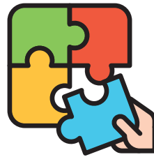
പസിലുകളും നിർമ്മാണ കളിയും