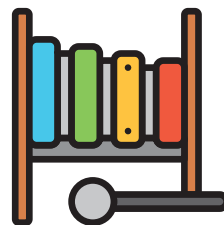
പാട്ടുപാടൽ, കേൾക്കൽ, സംഗീതം പലേ ചയ്യൽ